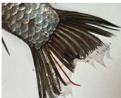
Рис. 2. Philometroides sanguinea в межлучевых перепонках хвостового плавника карася серебряного