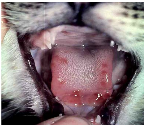
Рис. 1. Язвенные поражения ротовой полости при калицивирозе у кошек

Цель исследования – выработать наиболее эффективное средство для лечения калицивирусной инфекции кошек (рис. 1).