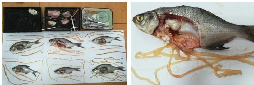
Рис. 4. Личинки цестоды Ligula intestinalis в брюшной полости леща