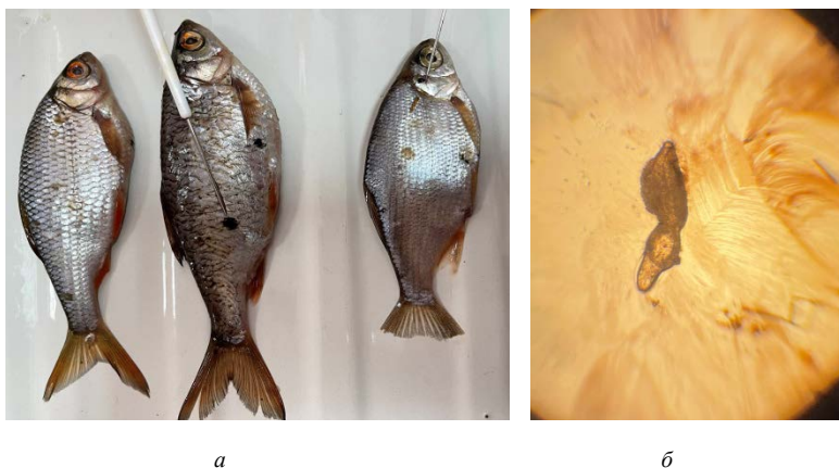
Рис. 3. Posthodiplostomum cuticola : а – пигментные пятна на поверхности кожи плотвы; б – метацеркарий в поле зрения микроскопа

В водохранилище Слободское в марте 2021 г. были выловлены и обследованы 10 экземпляров рыб (4 плотвы и 6 экземпляров густеры). У всех рыб на поверхности тела, жаберных крышек и плавниках были обнаружены единичные черные пятна. У плотвы черные пятна также были обнаружены после снятия чешуи на коже и в коже (рис. 3, а). При обследовании цист (извлечение, приготовление препаратов и микроскопия) в поле зрения микроскопа были обнаружены метацеркарии трематоды Posthodiplostomum cuticola (рис. 3, б).