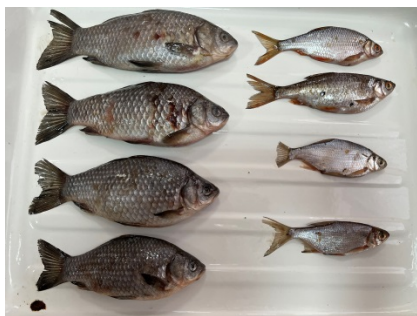
Рис. 1. Обследованная рыба

Результаты исследований и их обсуждение. При обследовании 10 экземпляров карася серебряного, выловленного в ноябре 2020 г., у четырех из них при визуальном осмотре в межлучевых перепонках хвостового плавника были обнаружены гельминты ярко красного цвета длиной 2–4 см – самки цестоды Philometroides sanguinea (рис. 2) с интенсивностью инвазии 1–4 паразита на рыбу, экстенсивность инвазии составила 40 %. Также у карася в данном водоеме был обнаружен сапролегниоз. Пруд Лань данным видом рыб зарыбляется для оказания услуг по платной рыбалке.