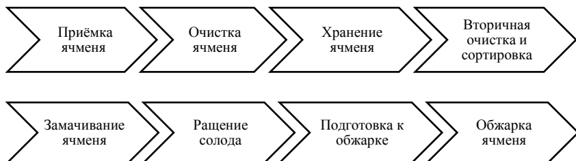
Рис. 1. Технологическая схема производства карамельного солода

Ячмень превращается в солод не сразу. Свежеубранный ячмень не достигает еще физиологической зрелости, т. е. в нем остаются не законченные биохимические процессы дозревания. Поэтому зерно должно отлежаться и дозреть в течении как минимум двух месяцев.