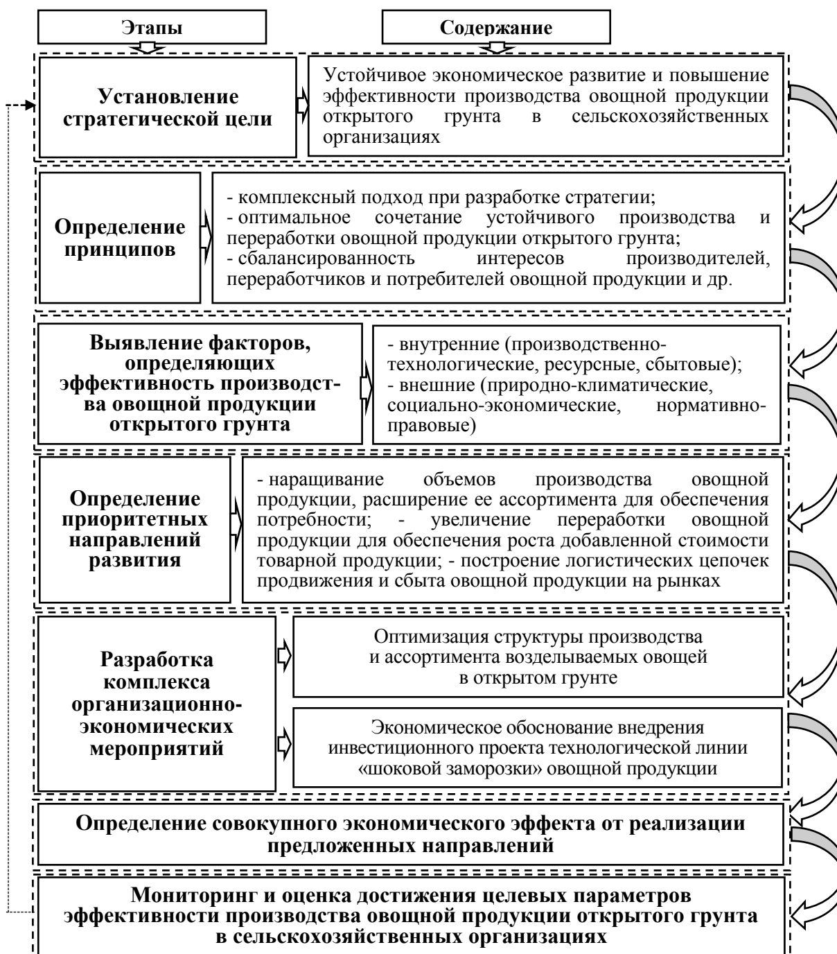
Рисунок 2 – Алгоритм разработки стратегии развития эффективного производства овощной продукции открытого грунта

Алгоритм разработки стратегии развития эффективного производства овощной продукции открытого грунта представлен на рисунке 2.