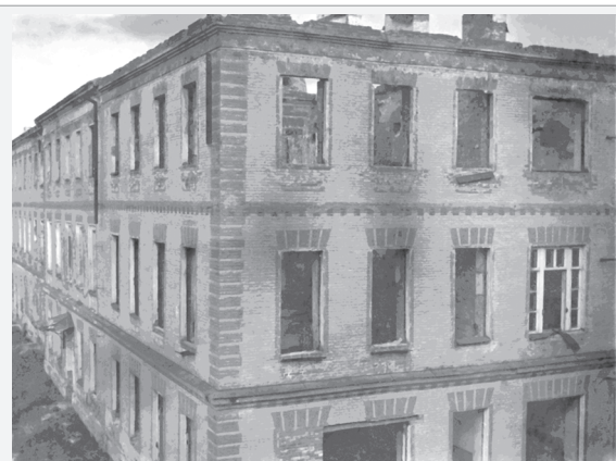
Учебный корпус №4, разграбленный и сожжённый фашистами (1944 г.)

К 80-летию освобождения Беларуси и Горецкого