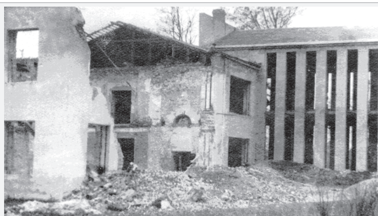
Разрушенное здание библиотеки Белорусского сельскохозяйственного института (1944 г.)