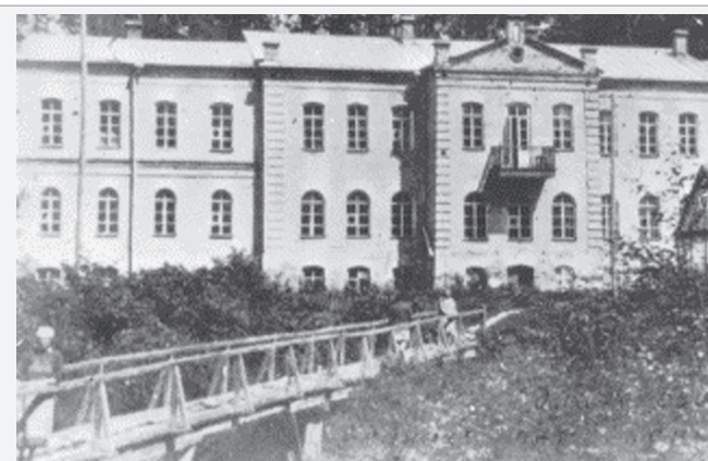
Учебный корпус кафедры сельскохозяйственных машин, который был разрушен немецкой авиацией (1941 г.)